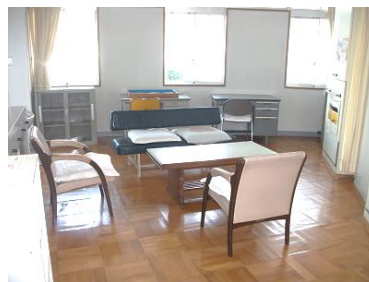
〈カウンセリングルーム〉